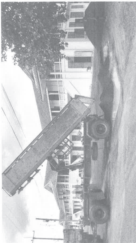
รูปภาพการดำเนินการปรับปรุงพื้นที่จอดยานพาหนะ